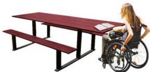
Table pique-nique PMR – 2000 mm :